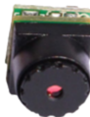
МІНІ ВІДЕОКАМЕРА "SIT-CAM-900 (900D)"