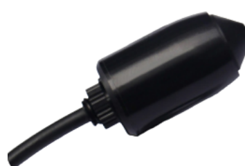
МІНІ ВІДЕОКАМЕРА "SIT-CAM-908"