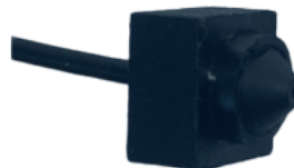
МІНІ ВІДЕОКАМЕРА "SIT-CAM-S5610-2V"